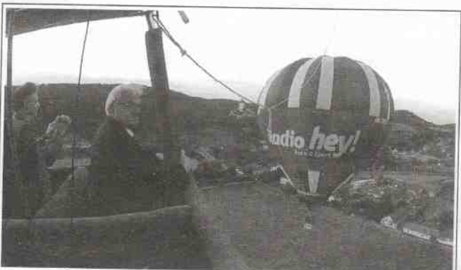
KARDINÁL ŽEHNAL BALÓNU. Kardinál Miloslav Vlk oslavil nedávno osmdesáté narozeniny. Část oslav se konala také v Karlštejně. Vlk nejprve absolvoval prohlídku II. okruhu na hradě, kde navštívil kapli sv. Kříže. Pak se v restauraci U Ezopa setkal s lidmi z Karlštejna a okolí. Nakonec požehnal balónu Karlštejn, kterým se také proletěl - let dostal darem od dlouholetého kamaráda. Kardinál toužil být pilotem, ale to mu nevyšlo, a tak si létání vyzkoušel až nyní. „Let byl klidný a přistání u Mníšku pod Brdy bezproblémové,“ uvedl Vladimír Glaser. (Iup)

Na konci prvního prázdninového měsíce - 27. 7. - se bude na nádvoří Karlštejna od 20.00 konat koncert Václava Neckáře. Vstupenky jsou k mání v karlštejnském Turistickém a informačním centru. (pef)